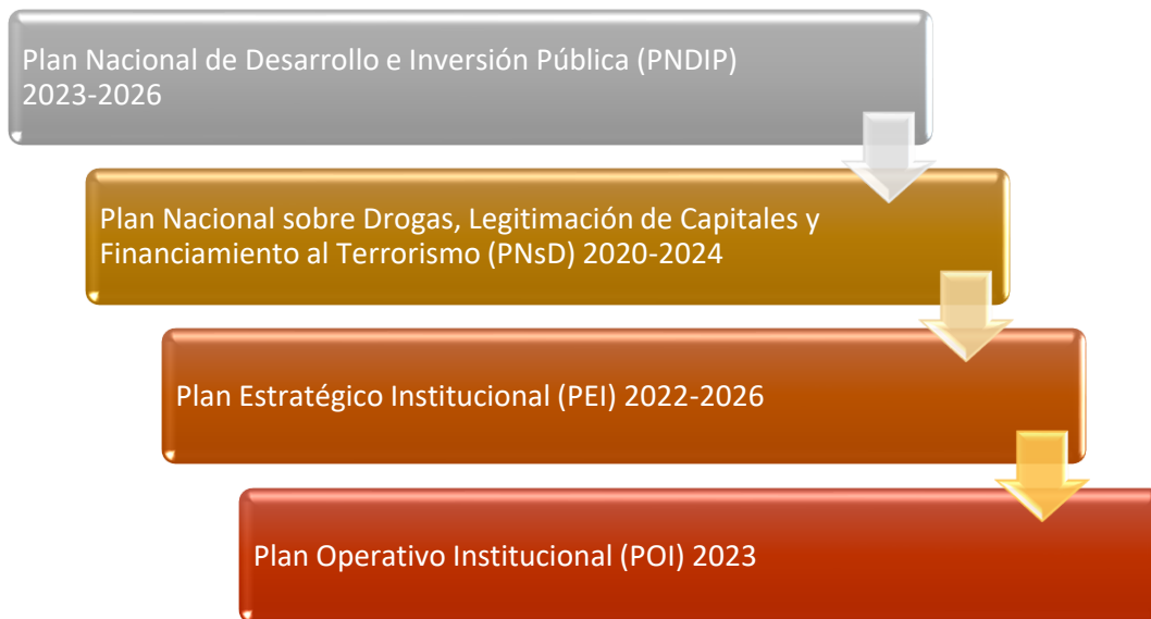
Figura 1. Planificación estratégica y operativa del ICD

Para este cometido, se vinculan los compromisos operativos del 2023 con aquellos de índole estratégica contenidos en los instrumentos: Plan Nacional de Desarrollo e Inversión Pública (PNDIP) 2023-2026, Plan Nacional sobre Drogas, Legitimación de Capitales y Financiamiento al Terrorismo (PNsD) 2020-2024, el Plan Estratégico Institucional (PEI) 2022-2026.