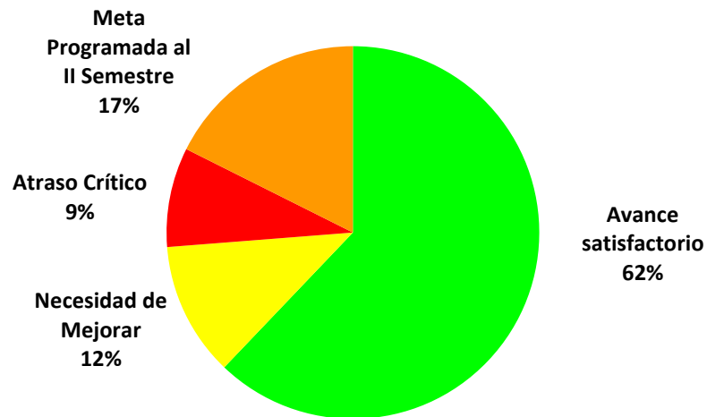
Gráfico 1 COSTA RICA: Porcentaje de Avance de las Metas Anuales de las Acciones Estratégicas a Nivel Sectorial, según clasificación Primer Semestre 2013