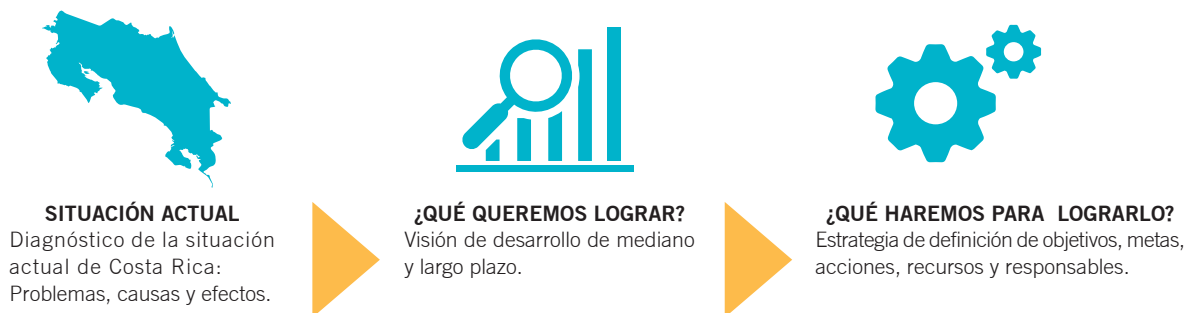
FIGURA 1: Elementos para definición de la estrategia de los ODS