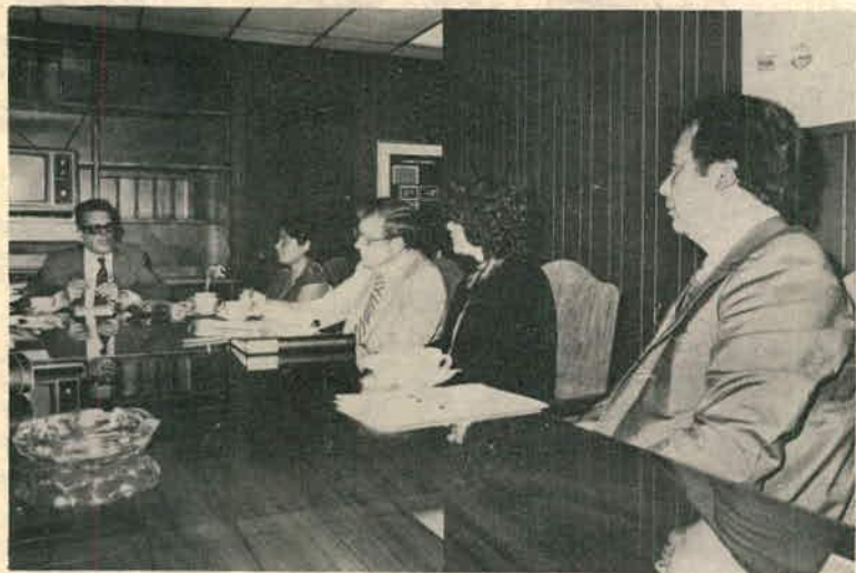
Reunión del señor Viceministro con la Misión del BID para tratar sobre el Plan de Inversiones Públicas 4 de octubre de 1982