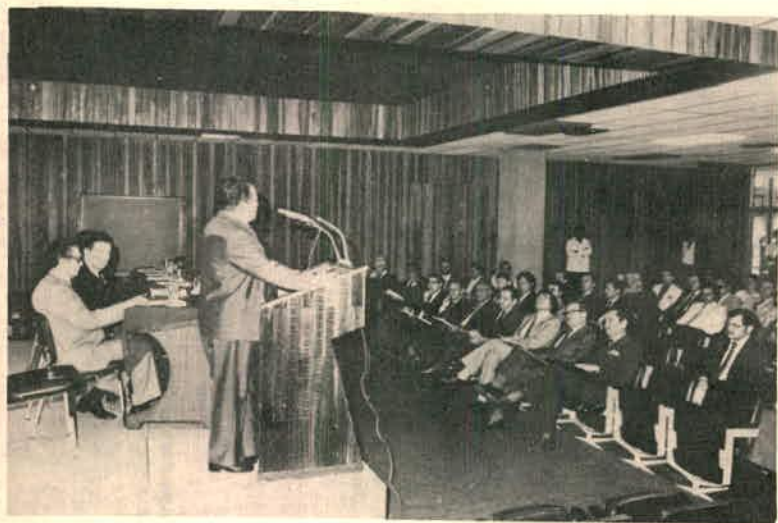
Reunión de Oficiales Mayores de Ministerios y Enlaces de Reforma Administrativa de Entes Descentralizados, para la reactivación del Subsistema de Reforma Administrativa 5 de agosto de 1982