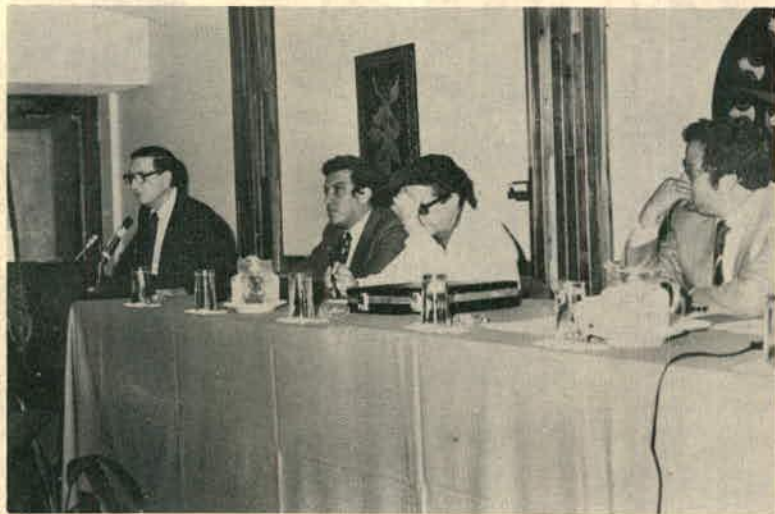
Reunión para analizar el Sistema de Planificación Nacional, Regionalización y Sectorialización 22 de agosto de 1982