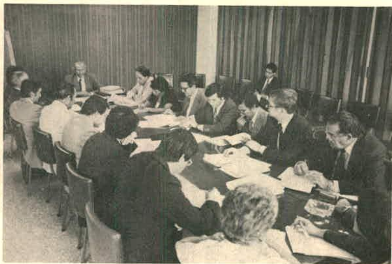
Reunión, con la participación del Segundo Vicepresidente de la República y Funcionarios del BID, para negociar el financiamiento de proyectos para desarrollarse en Costa Rica 17 de febrero de 1983