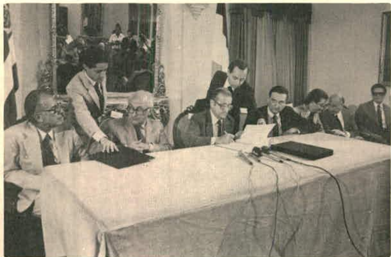
Firma del Convenio de ayuda entre Costa Rica e Italia por $42.000.000 que serán destinados a agroindustria, pesca, asuntos energéticos, promoción de exportaciones y educación 10 de mayo de 1982