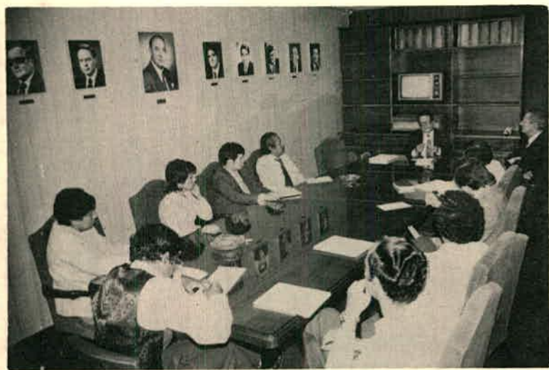
Reunión del señor Viceministro con el Lic. Eduardo Soto Harrinson, Embajador de Costa Rica en los Estados Unidos de América, para in- formarlo sobre las actividades de MIDEPLAN 10 de marzo de 1983