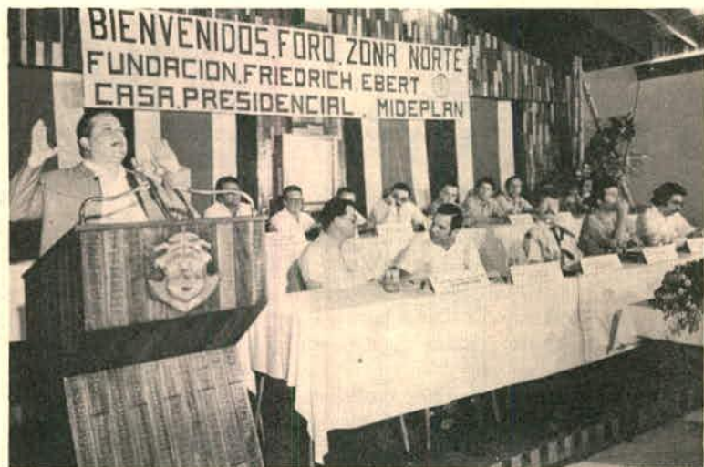
Exposición del señor Presidente de la República en el Foro de la Región Norte, realizado en San Carlos 18, 19 y 20 de marzo de 1983