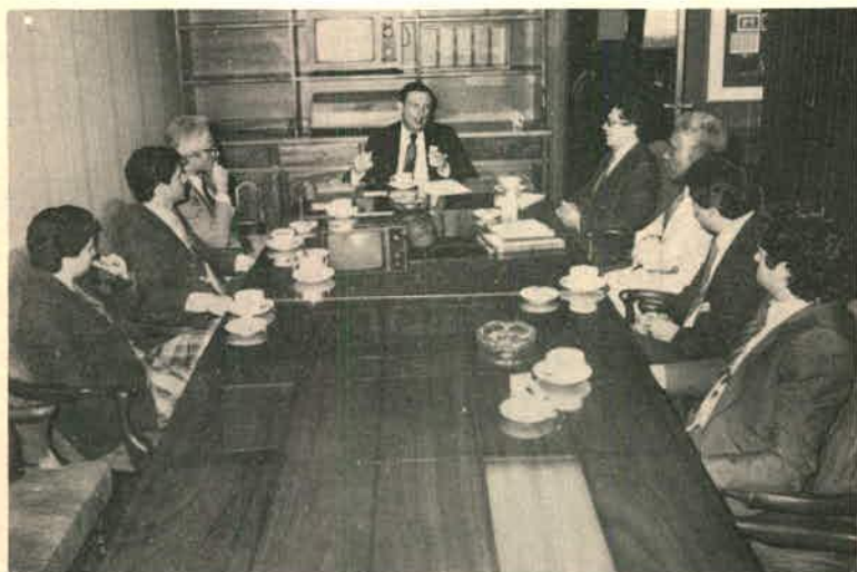
Reunión de los señores Ministro y Viceministro con los representantes del Centro Internacional de Investigaciones para el Desarrollo. 17 de noviembre de 1982