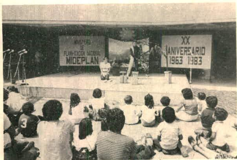
XX Aniversario de MIDEPLAN febrero de 1983. Actividad Cultural Plaza de la Cultura 29 de enero de 1983