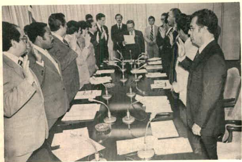
Juramentación del Consejo de Coordinación Interinstitucional por parte del señor Presidente de la República 7 de junio de 1982