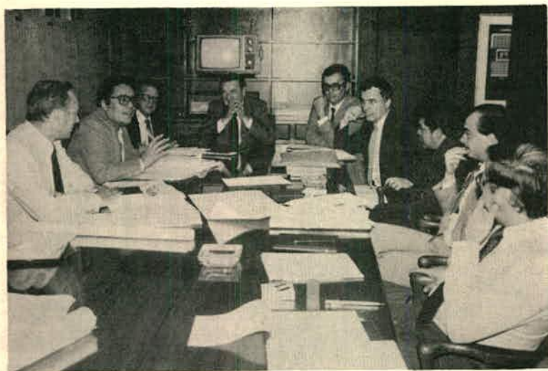
Reunión de representantes de diferentes instituciones con la Misión de la Comunidad Económica Europea, acerca de la donación de $18.000.000 para financiamiento del Proyecto de Desarrollo Rural 21 de febrero de 1983