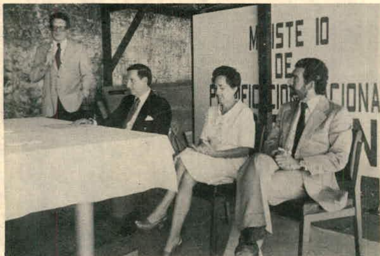
XX Aniversario de MIDEPLAN febrero de 1983. Ceremonia de reconocimiento a funcionarios con 20, 15 y 10 años de labores en la Institución. El señor Viceministro, uno de los homenajeados habla en nombre de ellos y en el suyo propio