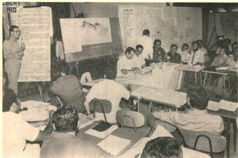
Disertación del señor Ministro en el Foro de la Región Norte, realizado en San Carlos 18, 19 y 20 de marzo de 1983