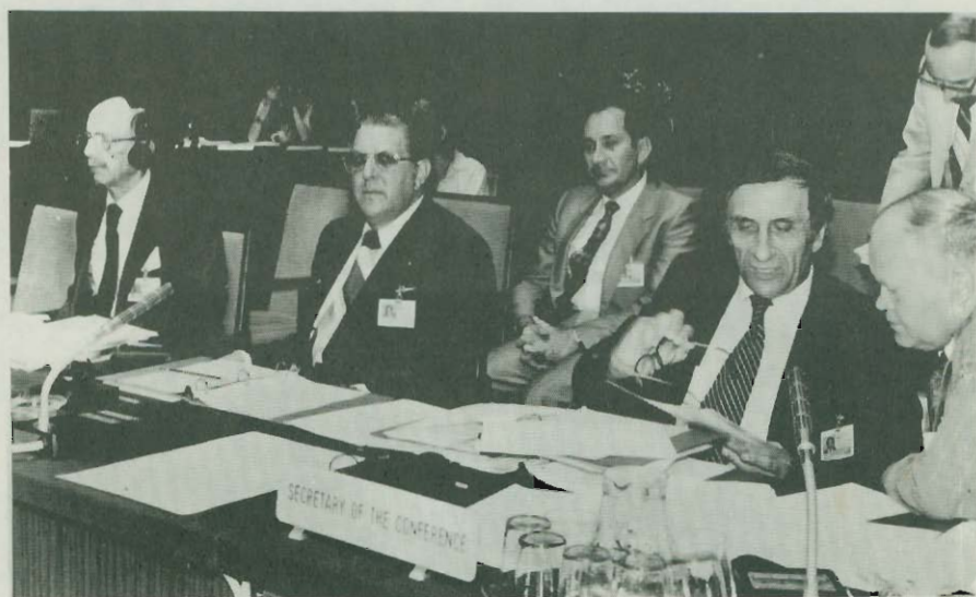
El señor Ministro-Director de la Oficina de Planificación Nacional y Política Económica en la Conferencia Mundial de las Naciones Unidas sobre Ciencia y Tecnología para el Desarrollo, en Viena, Austria, 18 al 31 de agosto, 1979