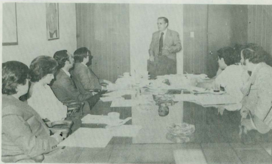
Reunión del Sr. Ministro de Planificación con la Misión Mexicana en esa Oficina. 2 de julio de 1979.