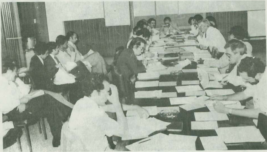
Reunión del Consejo de Coordinación Interinstitucional. 28 de marzo de 1980.