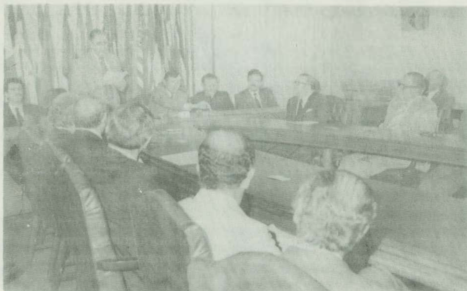
Entrega del Plan Nacional de Desarrollo por el señor Ministro-Director de OFIPLAN al Cuerpo Diplomático, en el Ministerio de Relaciones Exteriores 23 de noviembre de 1979.