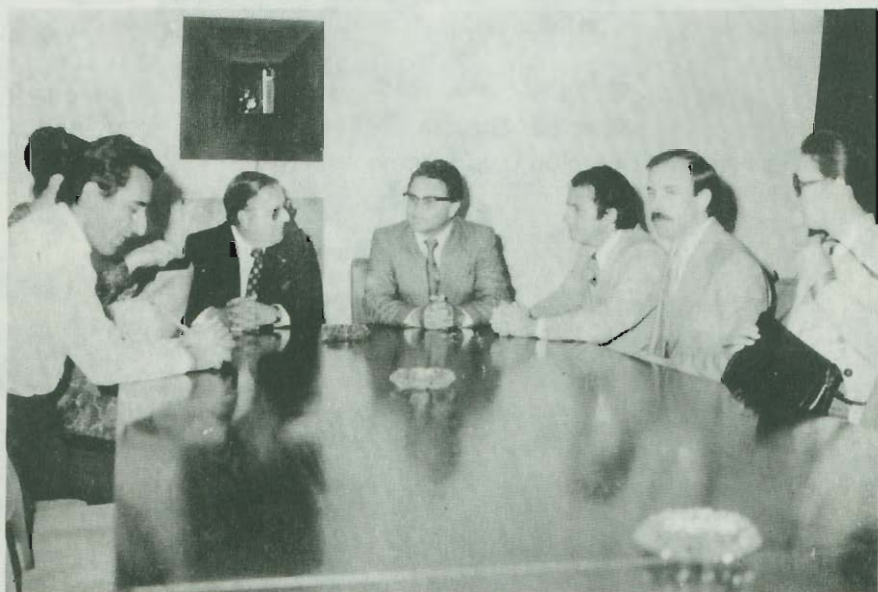
Visita del Sr. Ministro-Director de OFIPLAN a Yugoslavia. 20 al 22 de setiembre de 1979.