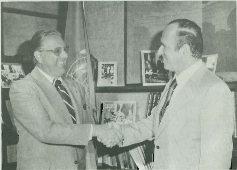
El Sr. Ministro-Director de DFIPLAN con el Director de la FAO, en la visita que hizo a Roma. Setiembre de 1979.

Tuvo también una audiencia con Su Santidad Juan Pablo II.