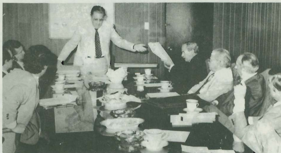
Entrega del Plan Nacional de Desarrollo a los Organismos Internacionales en OFIPLAN por el Sr. Ministro-Director. 27 de noviembre de 1979.