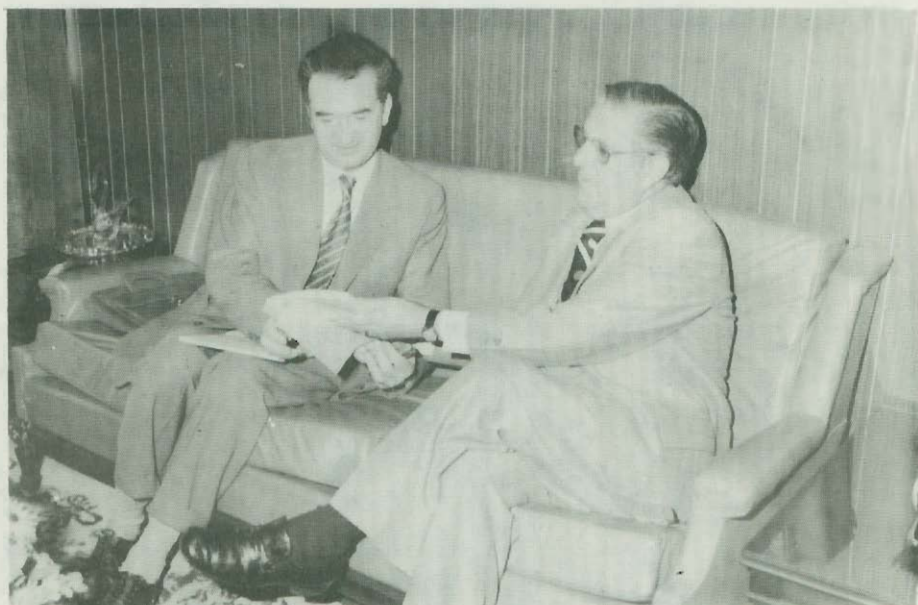
Embajador de Rumanía recibe copia del Plan Nacional de Desarrollo 1979-1982 "Gregorio José Ramírez"