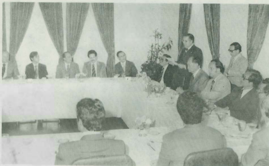
Recepción a la Misión de China por parte de OFIPLAN en el Hotel Costa Rica 4 de junio de 1979.