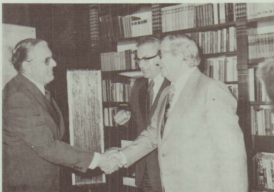
Visita a Israel del Sr. Ministro-Director de OFIPLAN, en la cual se entrevistó con el Sr. Presidente de ese país, Dr. Itzhak Navon. 16 de setiembre de 1979.