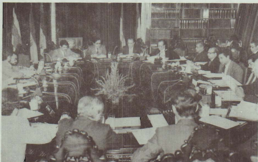
Reunión celebrada en el Banco Central, de la OFIPLAN con los Ministros y Vice-Ministros de Planificación de Centro América y Panamá. 18 de enero de 1980