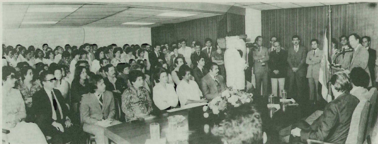
Entrega del Plan Nacional de Desarrollo 1979-1982 "Gregorio José Ramírez" al señor Presidente de la República, Lic. Rodrigo Carazo, en visita a la Oficina de Planificación Nacional y Política Económica. 26 de junio de 1979.