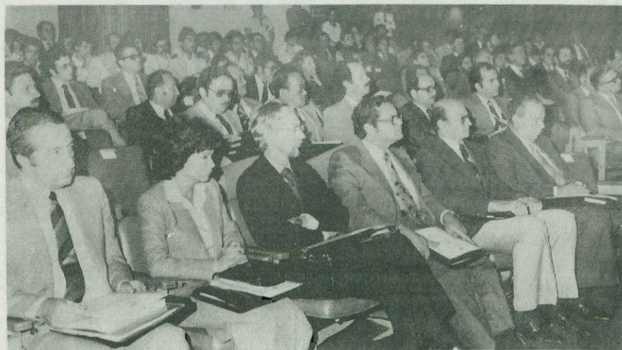
Panel de Reforma Administrativa con énfasis en conceptos y experiencias de Regionalización y Sectorialización, en Brasil, México, Perú y Costa Rica. Auditorio del INS. 7 de marzo de 1980.