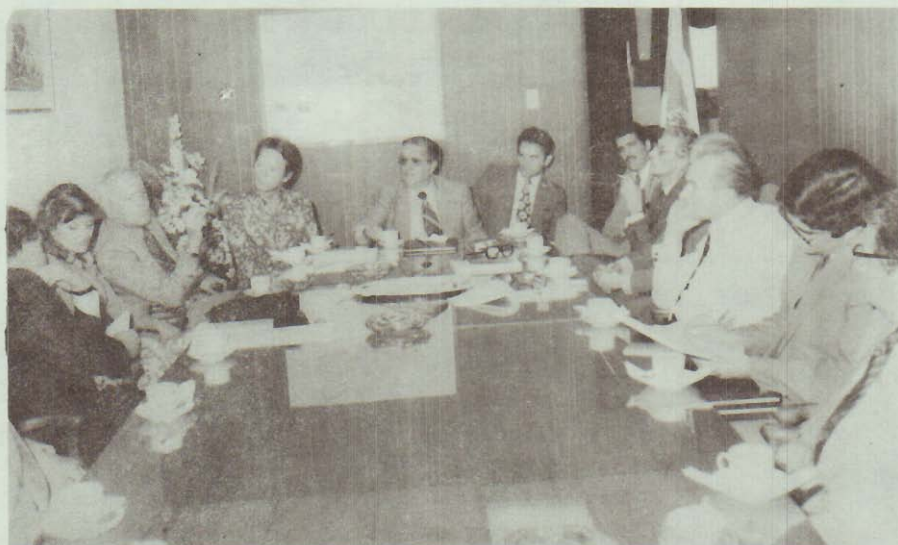
Visita del Sr. Ministro de Polonia a la Oficina de Planificación. 6 de noviembre de 1979.

nismos y gobiernos brindan a Costa Rica, de común acuerdo con el Ministerio de Relaciones Exteriores y Culto se organizaron sesiones de trabajo con ellos, en las cuales el Titular de dicha Oficina explicó los objetivos, alcances, metodología y contenido del Plan Nacional de Desarrollo 1979-1982 "Gregorio José Ramírez". Una de esas sesiones para el Cuerpo Diplomático tuvo lugar en el local de nuestra Cancillería y la otra en el de OFIPLAN.