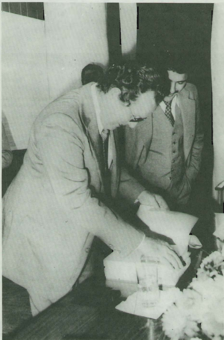
Entrega del Plan Nacional de Desarrollo al Sr. Presidente de la República, Lic. Rodrigo Carazo