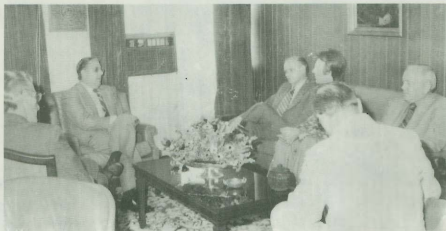
Visita del Sr. Ministro de Polonia a la Oficina de Planificación 6 de noviembre de 1979.