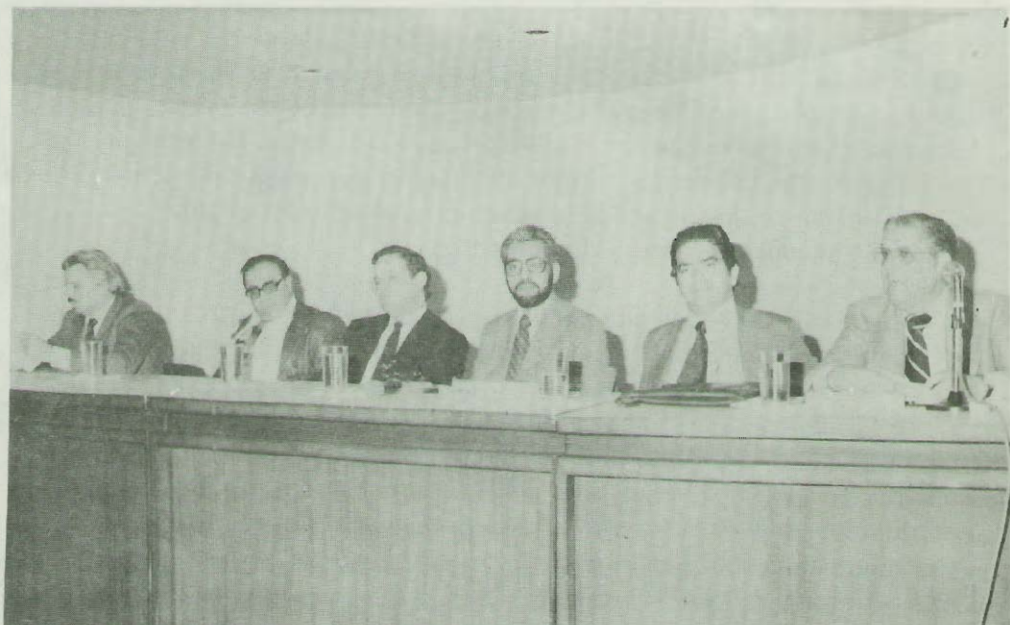
Conferencia del Sr. Ministro-Director de OFIPLAN en el INS con motivo de celebrarse los diez años del Colegio de Licenciados en Ciencias Económicas. 27 de marzo de 1980.