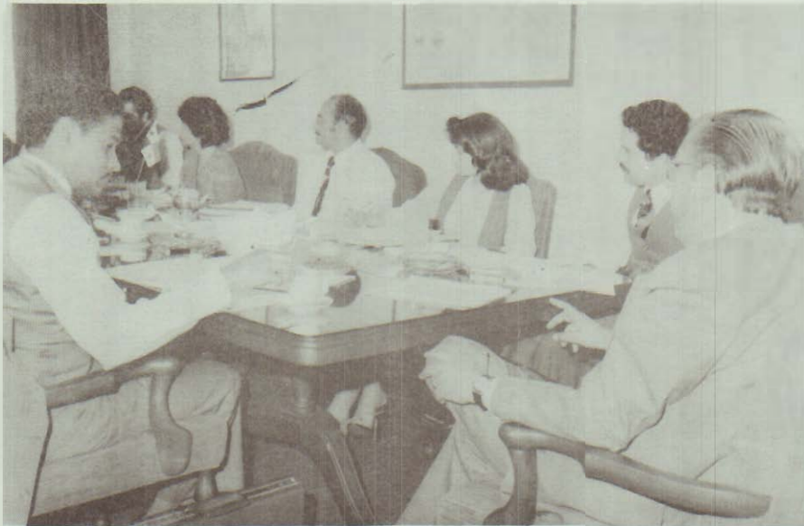
Reunión en la OFIPLAN con la Comisión Nacional de Panamá y Costa Rica para Tratado Limítrofe. 25 de mayo de 1979.