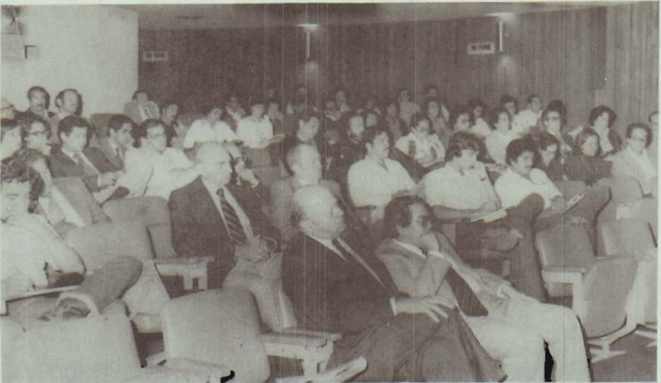
Visita del Secretario Ejecutivo de la CEPAL, Dr. Enrique Iglesias a nuestro país en donde participó en varias conferencias. 22 de mayo de 1979.