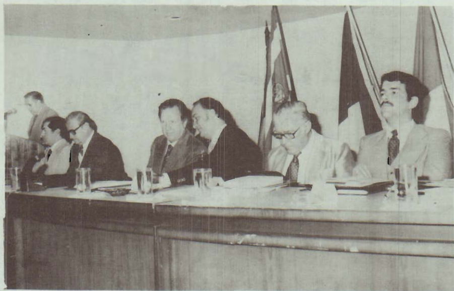
Panel de Reforma Administrativa con énfasis en Conceptos y Experiencias de Regionalización y Sectorialización, en Brasil, México, Perú y Costa Rica. Auditorio del INS. 7 de marzo de 1980.

Se resaltó, por el análisis comparativo de las experiencias de cada país participante, la orientación integral y el apoyo político sistemático de dicho esfuerzo en Costa Rica, durante la presente Administración del Presidente Carazo. Los planeamientos y soluciones institucionales que hemos impulsado en Costa Rica y aprovechando el gran aporte de experiencias en Administraciones pasadas, comprobaron ser sumamente originales y novedosas en el contexto latinoamericano.