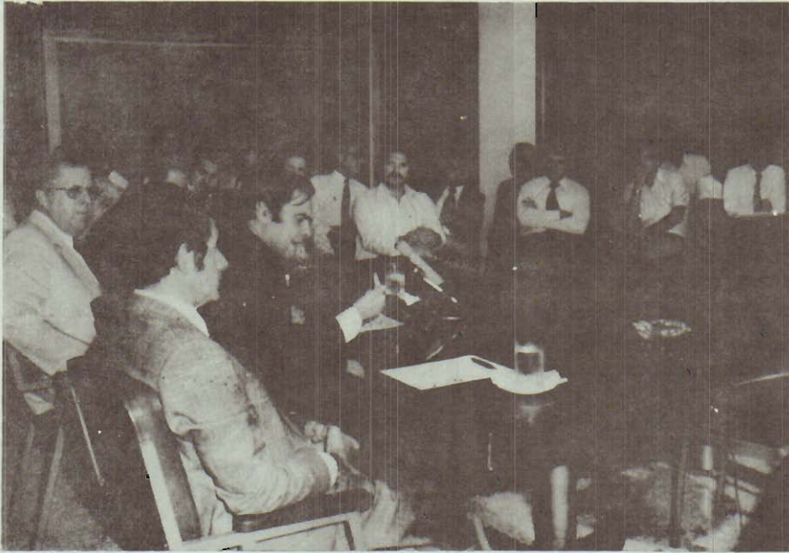
Visita del Secretario Ejecutivo de la CEPAL, Dr. Enrique Iglesias, a nuestro país en donde participó en varias Conferencias. 22 de mayo de 1979.