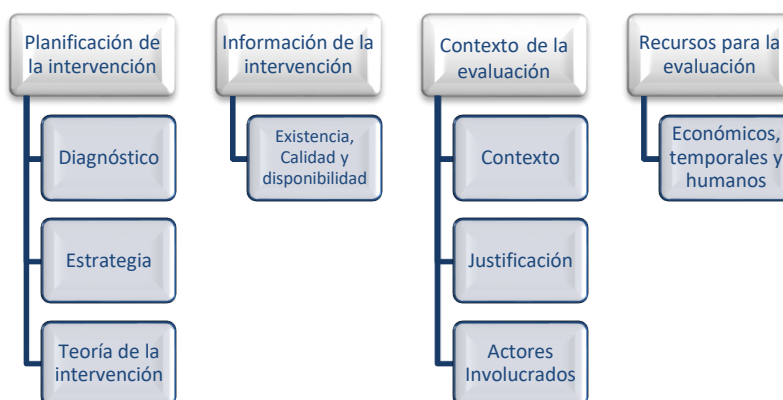
Ilustración 1. Estudio de Evaluabilidad

El estudio se fundamentó en un enfoque principalmente cualitativo, por medio del despliegue de técnicas de investigación como la revisión bibliográfica, entrevista –semi-estructurada- y observación, así como el análisis documental y la triangulación de fuentes de información como estrategia de análisis para la debida fundamentación de hallazgos, conclusiones y recomendaciones.